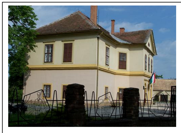
Az Ostffy-kastély 1898-ban és 2010-ben Ostffyasszonyfán.

Ugyancsak az Ostffy család birtokában volt az ostffyasszonyfai Weöres - Ostffy-kastély