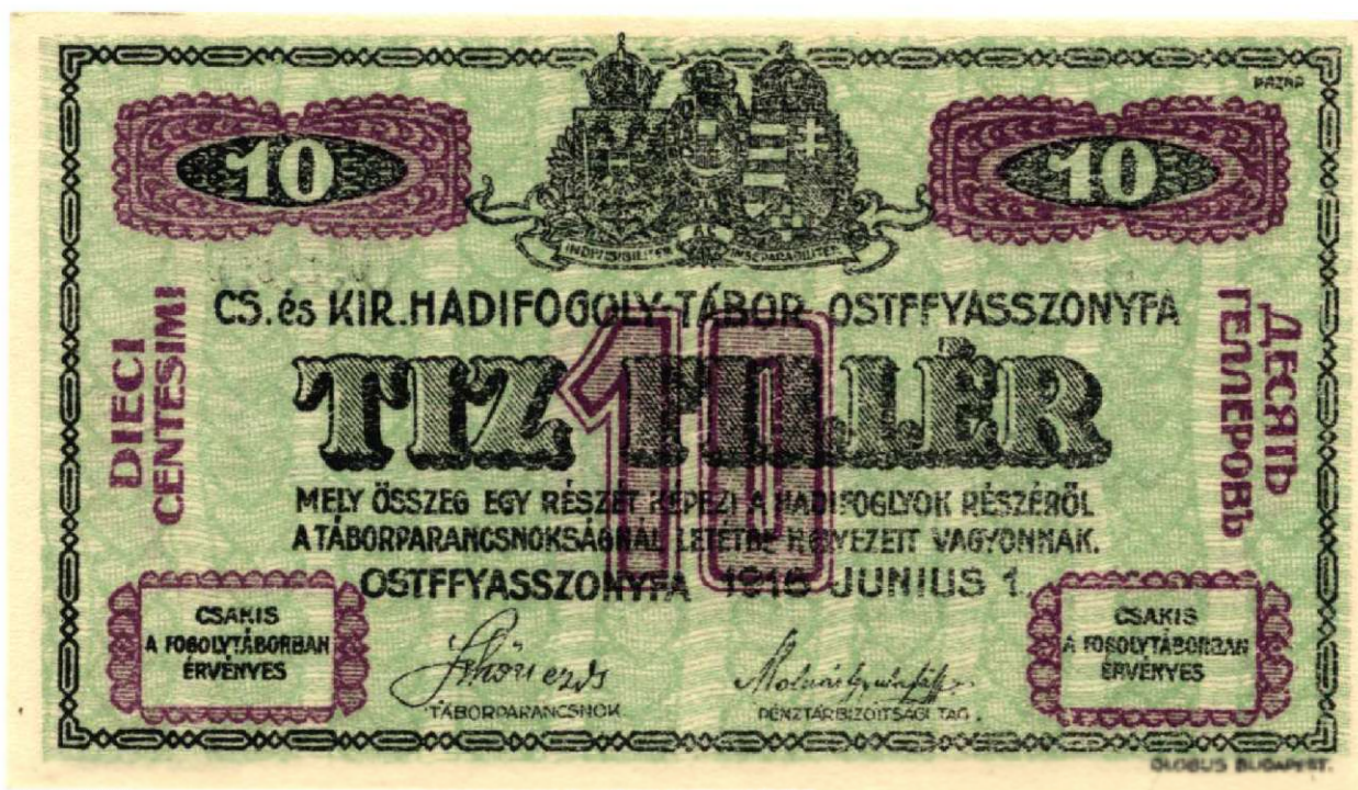
„Tíz Fillér” magyar nyelvű oldala