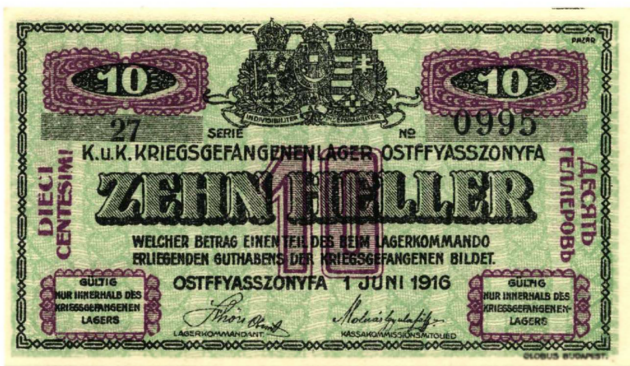
„Tíz Fillér” német nyelvű oldala.

Színe halványzöld alapon függőleges szívfűzér fekete és halványlila motívumos díszítés, fekete betűkkel.