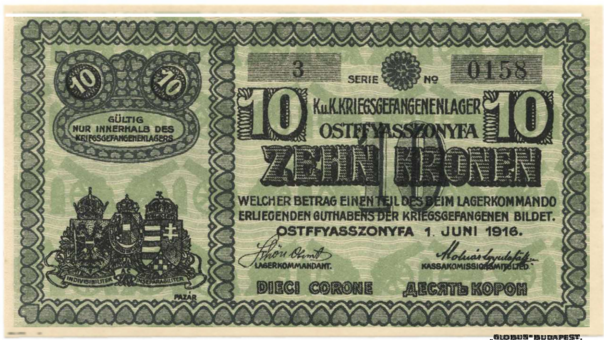
A „Tíz Korona” németnyelvű oldala

A „Tíz Korona” színe zöld alapon körben rovátkás szívfüzérrel 20 szembenéző ágyúval, köztük felállított lőszer.