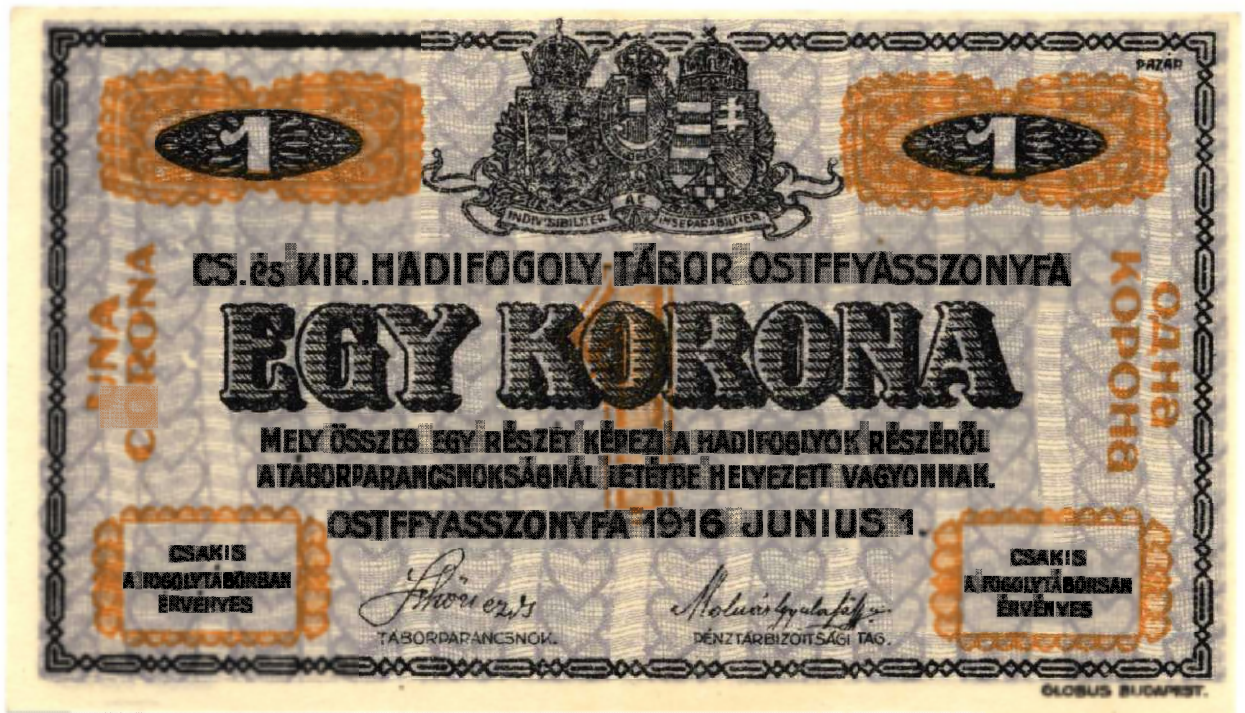
„Egy Korona” magyar nyelvű oldala