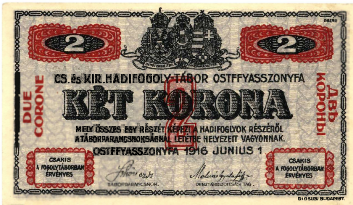
„Két Korona” magyar nyelvű oldala