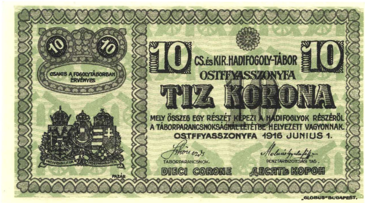
„Tíz Korona” magyarnyelvű oldala

A pénzeken a név és a számok több nyelven is olvashatók.