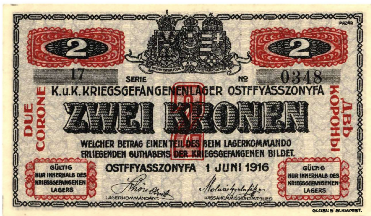
A „Két Korona” német nyelvű oldala

Színe halványkék alapon függőleges szívfüzérek, fekete írással, piros díszítéssel, a motívumok láncdíszítéssel.