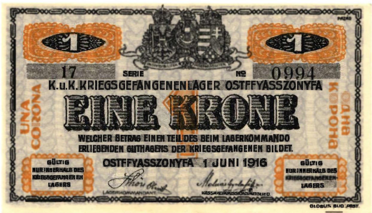
„Egy Korona” német nyelvű oldala.

Színek halványkék alapon függőleges szívfüzérek, fekete írással, halvány téglavörös motívumos díszítés.